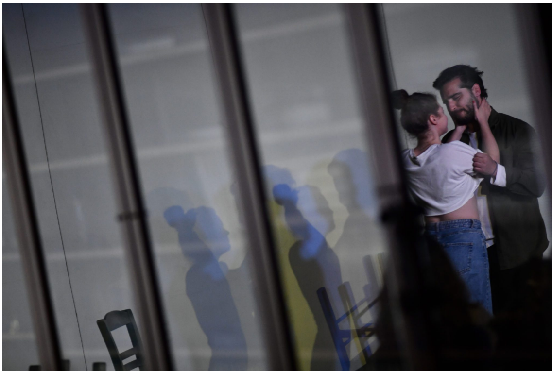
«Οι κάτω απ' τ' αστέρια»

Τέσσερις μέρες κράτησε το φεστιβάλ μας. Πολύς κόσμος έδωσε το παρών, πάνω από διακόσια άτομα. Ολων των ηλικιών. Όταν φεύγαμε όλοι ρωτούσαν πότε θα ξαναπάμε, μας λέγανε πόση ανάγκη έχουν από δράσεις τέχνης, πολιτισμού, πόση ανάγκη έχουν τα παιδιά από δραστηριότητες, από δυνατότητες να καλλιεργήσουν τις κλίσεις, τα ταλέντα τους. Εμείς τους είπαμε ότι θα κάνουμε τα πάντα για να είμαστε εκεί κάθε χρόνο – κι αν κι αυτό σίγουρα δεν είναι αρκετό για τις ανάγκες ενός τόπου, ενός τέτοιου τόπου όπως η Σαμοθράκη, θα προσπαθήσουμε να μεγαλώσουμε το φεστιβάλ μας όσο πάει, να το φτάσουμε έως τη θάλασσα κι ακόμη παραπέρα.